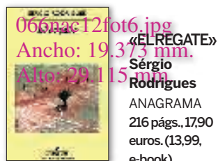
066nac12fot6.jpg «EL REGATE» Sérgio Rodrigues ANAGRAMA 216 págs., 17,90 euros. (13,99, e-book)

Sérgio Rodrigues toma el fútbol como el motor de una novela sobre un jugador ficticio