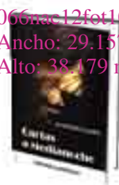
«Cartas a medianoche» Almudena Zaldo / Lampedusa 400 páginas, 18 euros

Pasión inesperada, erotismo e intensidad son los principales ingredientes de este thriller psicológico que llega para poner en evidencia el lado oscuro de las redes sociales. Su protagonista es una mujer que se enamora locamente de un desconocido a través de internet y se deja llevar por una pasión tan letal como absorbente que de nuevo demuestra que «no todo es lo que parece».