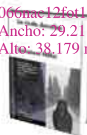
«La viuda descalza» S. Niffoi / Malpaso 186 páginas, 17,50 euros

Con una sobrecogedora potencia literaria, «La viuda descalza» cuenta la historia de Mintonia Savuccu, una mujer que se ve implicada sin quererlo en un ajuste de cuentas con el objetivo de dejar atrás el recuerdo de su primer amor y cumplir con una deuda que solo se paga con sangre. Esta obra, publicada por primera vez en 2006, le valió el premio Campiello a su autor, Salvatore Niffoi.