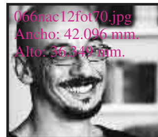
066nac12fot70.jpg Ancho: 42.096 mm. Alto: 36.349 mm.

Pero las diferencias generacionales y de carácter se hacen